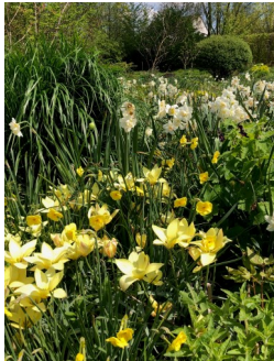
Narcissen en Botanische tulpen

voorzichtig wieden dus. Als je goed kijkt vind je vaak nog een klein zwart zaadje op het uiteinde van de zaailing / grasspriet. Bij het Enode gebouw en op de Oude Dijk zijn in het voorjaar ook Narcissen en Krokussen te vinden die zich (hopelijk) blijven uitbreiden. Aanplant van de bollen kan het beste gebeuren in het najaar: September tot begin Oktober. Plant de bol ongeveer drie keer zo diep als de hoogte van de bol dan komt het in het voorjaar helemaal goed.