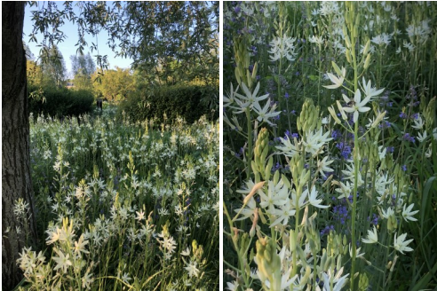
Verwilderingsbollen Camassia's 5 jaar na aanplant, uitgezaaid en vermeerderd

Bekende kleine verwilderingsbollen zijn: Sneeuwklokjes, Blauwe druifjes en Krokussen. Door deze bijvoorbeeld in het gras te planten vallen ze goed op. Na de bloei duurt het zes weken voordat ze zich hebben uitgezaaid en tot die tijd is het raadzaam het gras niet te maaien.