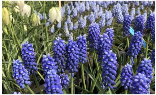
Sneeuwklokje, Krokus en Blauw druifje